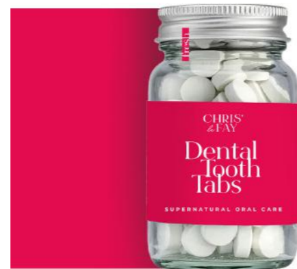
High-quality dental beauty line