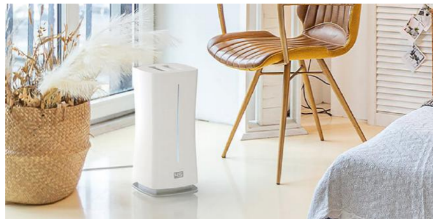
Aroma essences & diffusers